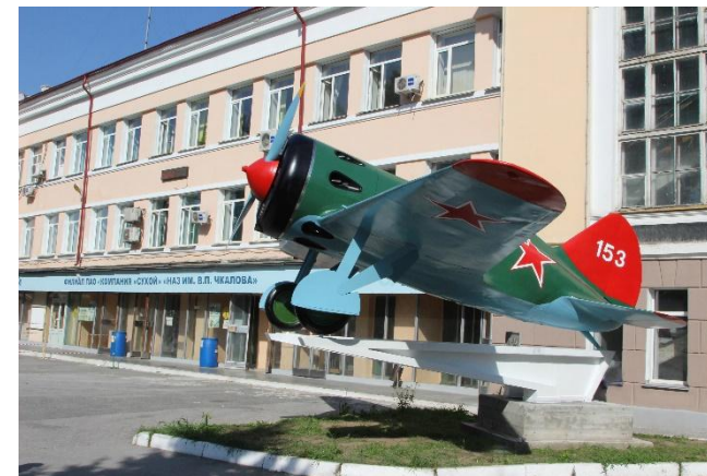
Самолет И-16 около здания проходной НАЗ.

Далее НАЗ выпускал продукцию КБ А.С. Яковлева (Як), КБ Микояна и Гуревича (МиГ), КБ П.О. Сухого (Су).