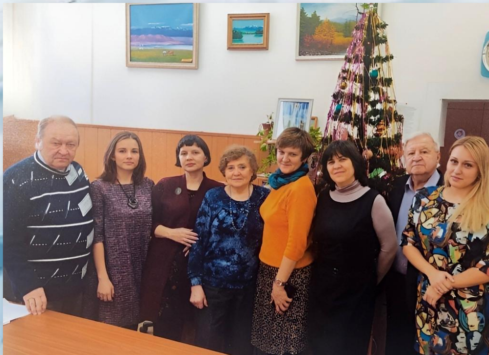
КАФЕДРА Вив, 2019 г.