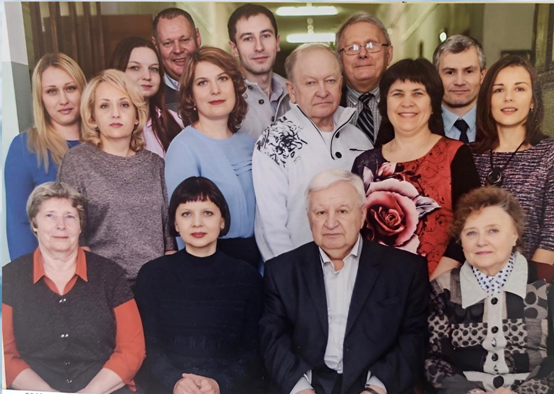
КАФЕДРА Вив, 2019 г.