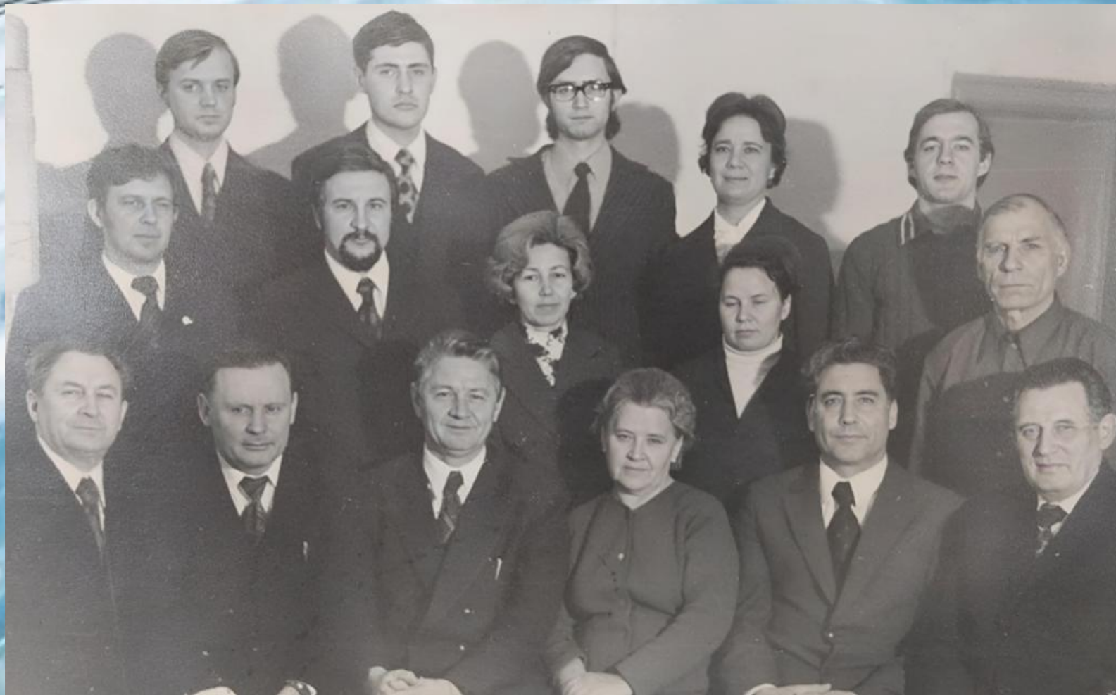
КАФЕДРА ВИВ. СНИМОК 1978 г.