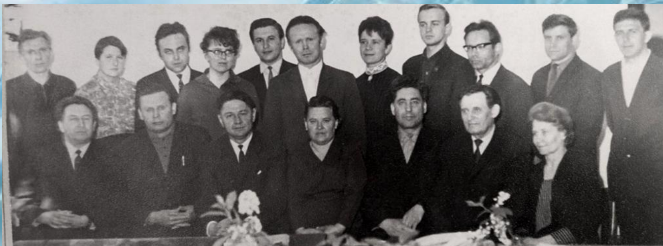
КОЛЛЕКТИВ КАФЕДРЫ ВИК, 1969 г.

Преемственность поколений была залогом успешного существования кафедры. Большинство преподавателей именитых и не очень сначала были студентами института (университета) потом оставались преподавать, вели научный поиск, защищали диссертации и передавали накопленный опыт своим студентам.