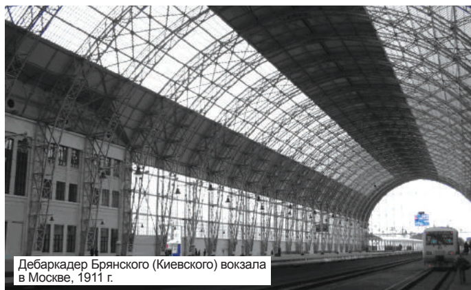
Дебаркадер Брянского (Киевского) вокзала в Москве, 1911 г.