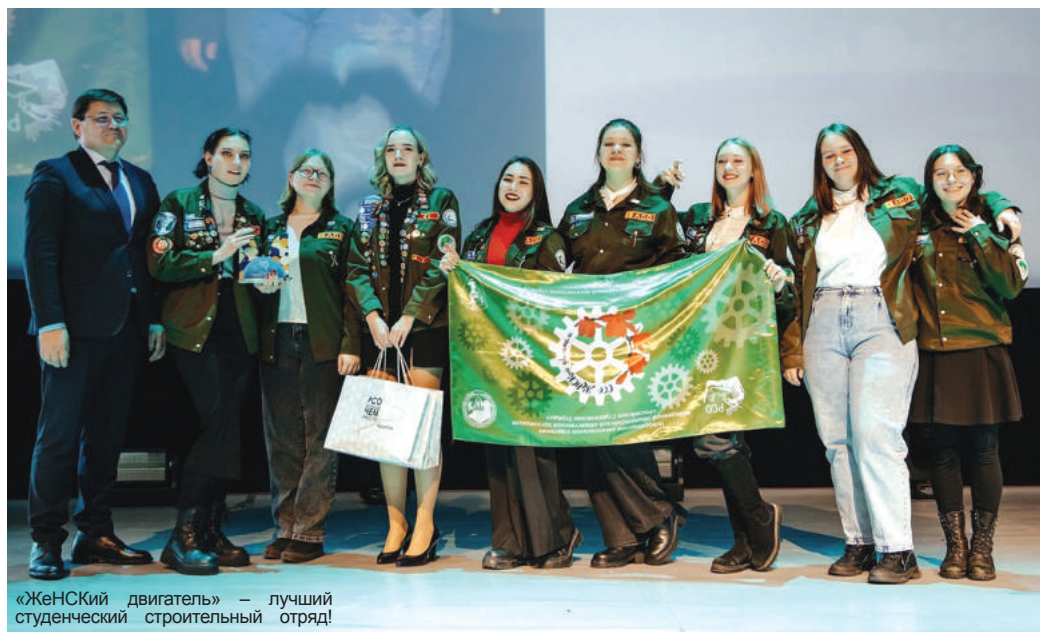
«ЖеНСкий двигатель» – лучший студенческий строительный отряд!