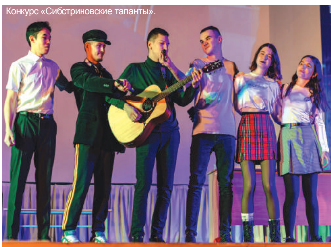
Конкурс «Сибстриновские таланты».

Второе же событие, открывающее дверь в отрядную жизнь для только что вступивших парней и девушек, – «Сибстриновские таланты». Это мероприятие ежегодно проводится в нашем университете, дабы юные бойцы шести отрядов показали свою креативность, организованность и умение работать в команде. Каждый из отрядов подготовил свою цельную концертную программу с зажигательными танцами, творческими видео, запоминающимися песнями и лиричной поэзией. Это действительно интересно и крайне важно: люди, которые никогда прежде не танцевали, не пели, а кто-то даже на сцене не бывал, – рвут собственные рамки и добиваются успеха благодаря совместной работе. В этом году особенно отличились парни из ССО «Сибстриновец», забрав 1-е место по совокупности баллов. 2-е же место заняли проводники из СОП «За горизонтом», а 3-е – ребята из смешанного ССО «Каскад». Все эти молодые люди показали, что они – достойное пополнение в семье