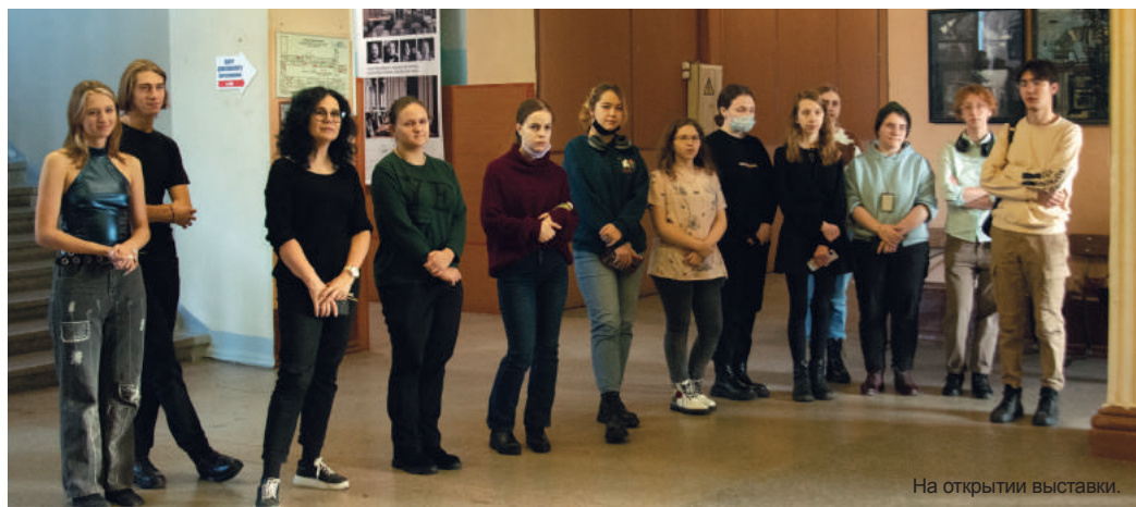
На открытии выставки.