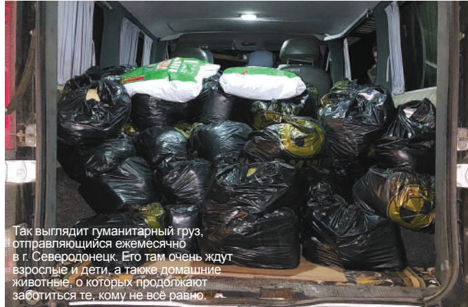
Так выглядит гуманитарный груз, отправляющийся ежемесячно в г. Северодонецк. Его там очень ждут взрослые и дети, а также домашние животные, о которых продолжают заботиться те, кому не всё равно.