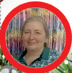
З. редактор Э.В. Попова