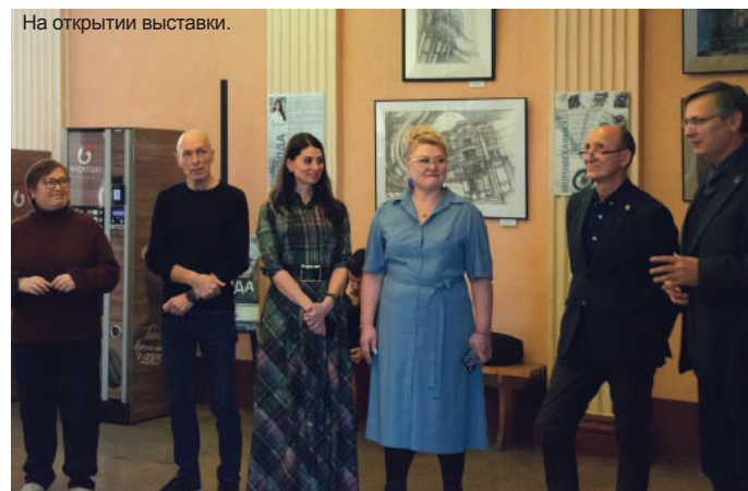
На открытии выставки.

– Слышала как-то от одного байкера: «Я никогда бы не стал художником, терпения не хватает!» На самом деле лю-